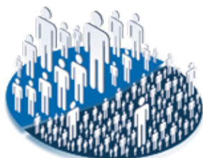
Értékesítési területek felosztása