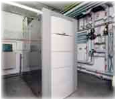
Brennstoffzellen-Heizgerät im Feldtest unter Praxisbedingungen

K ernstück des Brennstoffzellen-Heizgerätes ist die Brennstoffzelle, welche aus Erdgas gewonnenem Wasserstoff und dem Sauerstoff aus der Luft, Strom und Wärme erzeugt. Die Wärme wird für den Heizungs- und Warmwasserbedarf genutzt, der Strom wird im Haus selbst verbraucht oder gegen Vergütung ins öffentliche Netz eingespeist. Jeder Hausbesitzer wird so gewissermassen sein eigener Kraftwerksbetreiber.